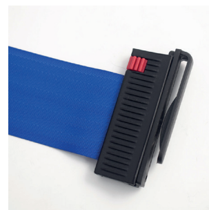
Attacco per cintura

Kit Ricevente per nastri applicabile a tutte le nostre linee di colonnine con nastro. Composto da un attacco ricevente da muro, un attacco ricevente per cintura e kit di viti e tasselli. Ø Fori per fissaggio a muro: 4mm