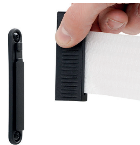
Attacco a muro